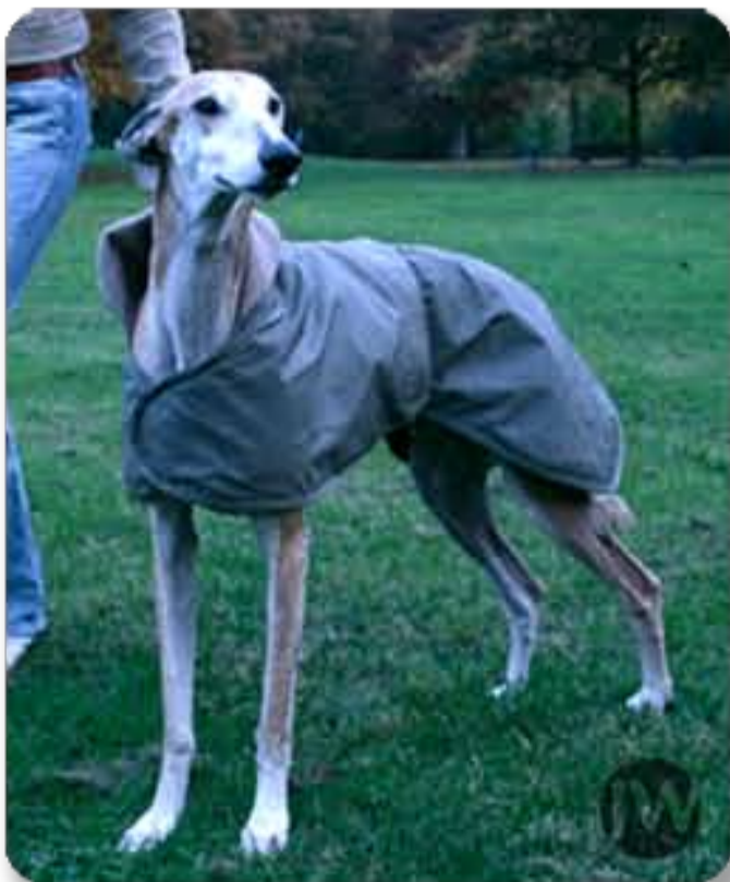
Preis 49,95€ (mit Schrägband)

Ein mit Fließ verstärkter Regenmantel schützt Ihren vierbeinigen Liebling vor Wind, Kälte und Regen.