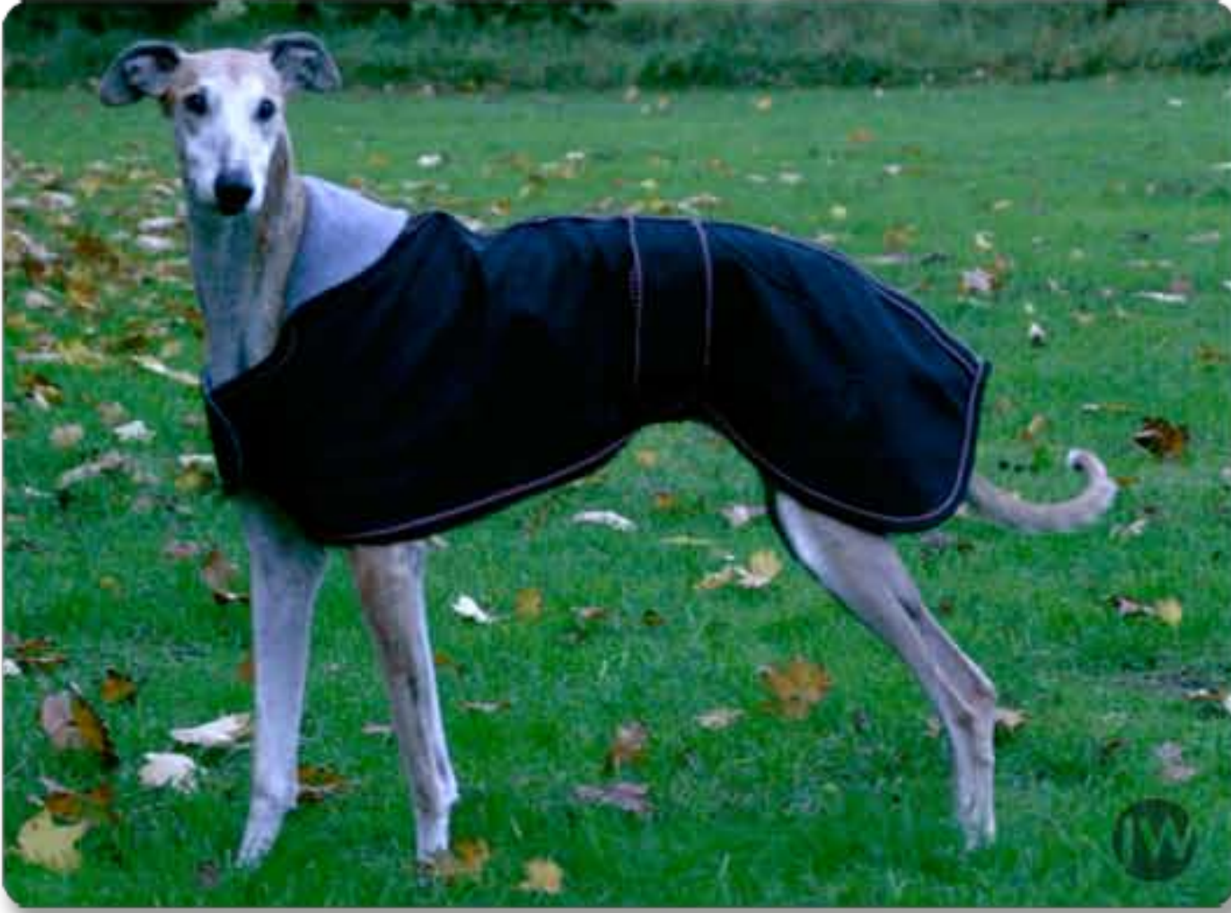
Preis 59,95€ (mit Paspelband)

Ein mit Fließ verstärkter Regenmantel schützt Ihren vierbeinigen Liebling vor Wind, Kälte und Regen.